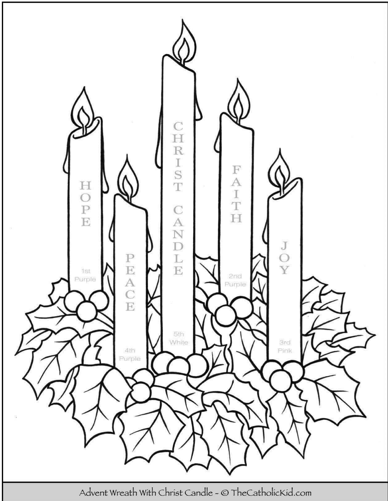
Advent Wreath With Christ Candle