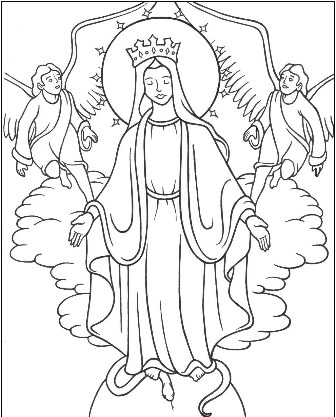
5th Glorious Mystery: The Coronation