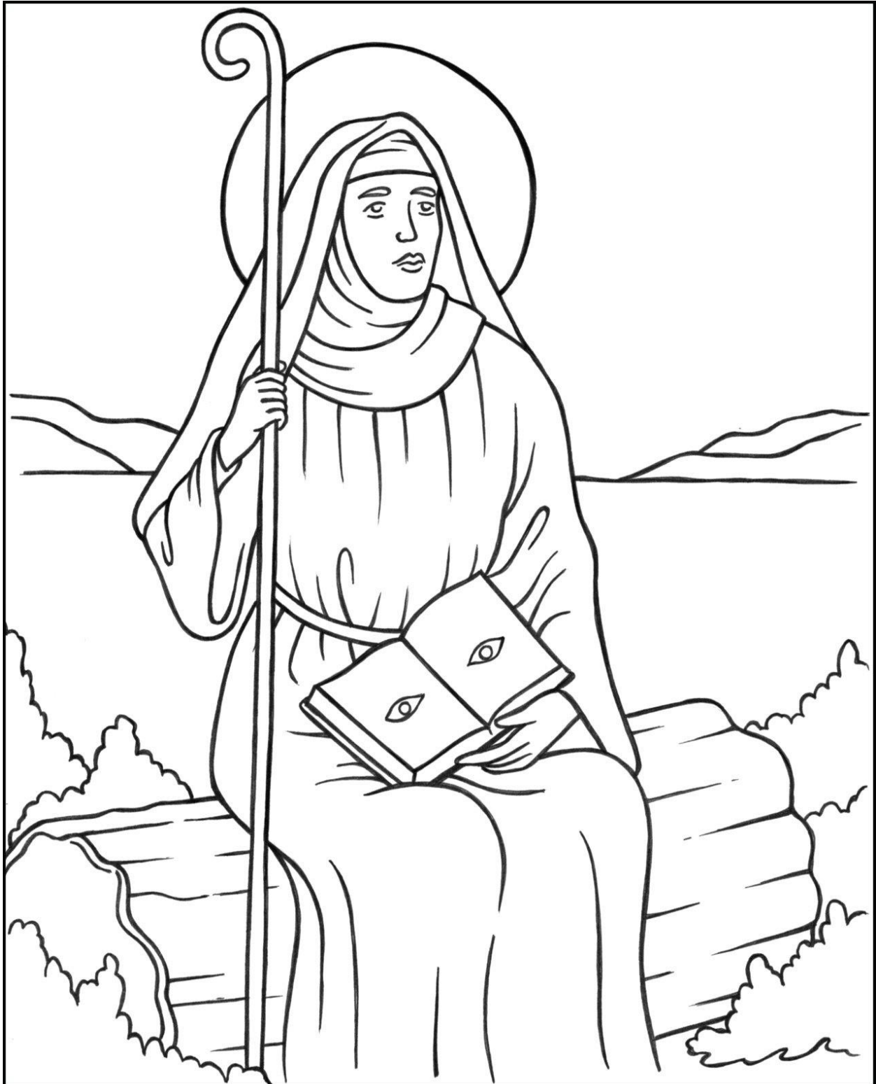
Saint Monica