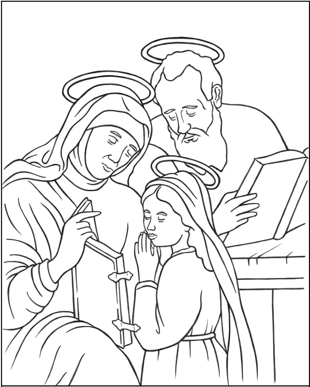
Saint Joachim, Saint Anne & Saint Mary